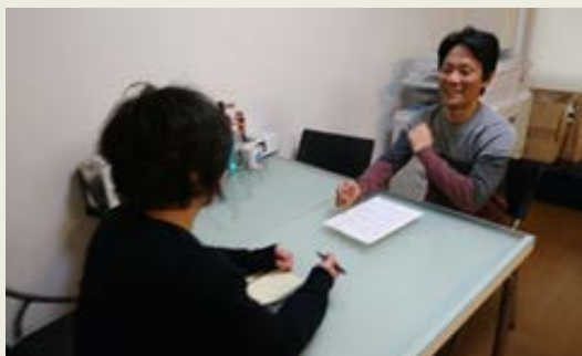
<打ち合わせの様子>

具体的には、各マスメディア(TV・新聞・雑誌・WEB)へクライアントの商品やサービスに絡めた情報・企画の提案を行い、取材・誘致を行うことや、イベントや記者発表会などの企画・運営を行っています。