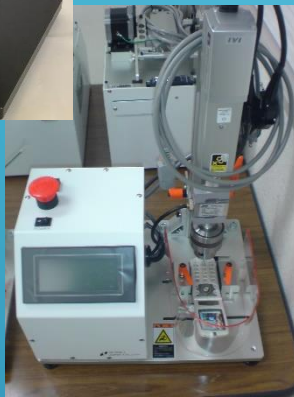
押しボタン 試験機→