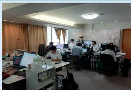
10階のオフィスからの眺望は息抜きにも最適